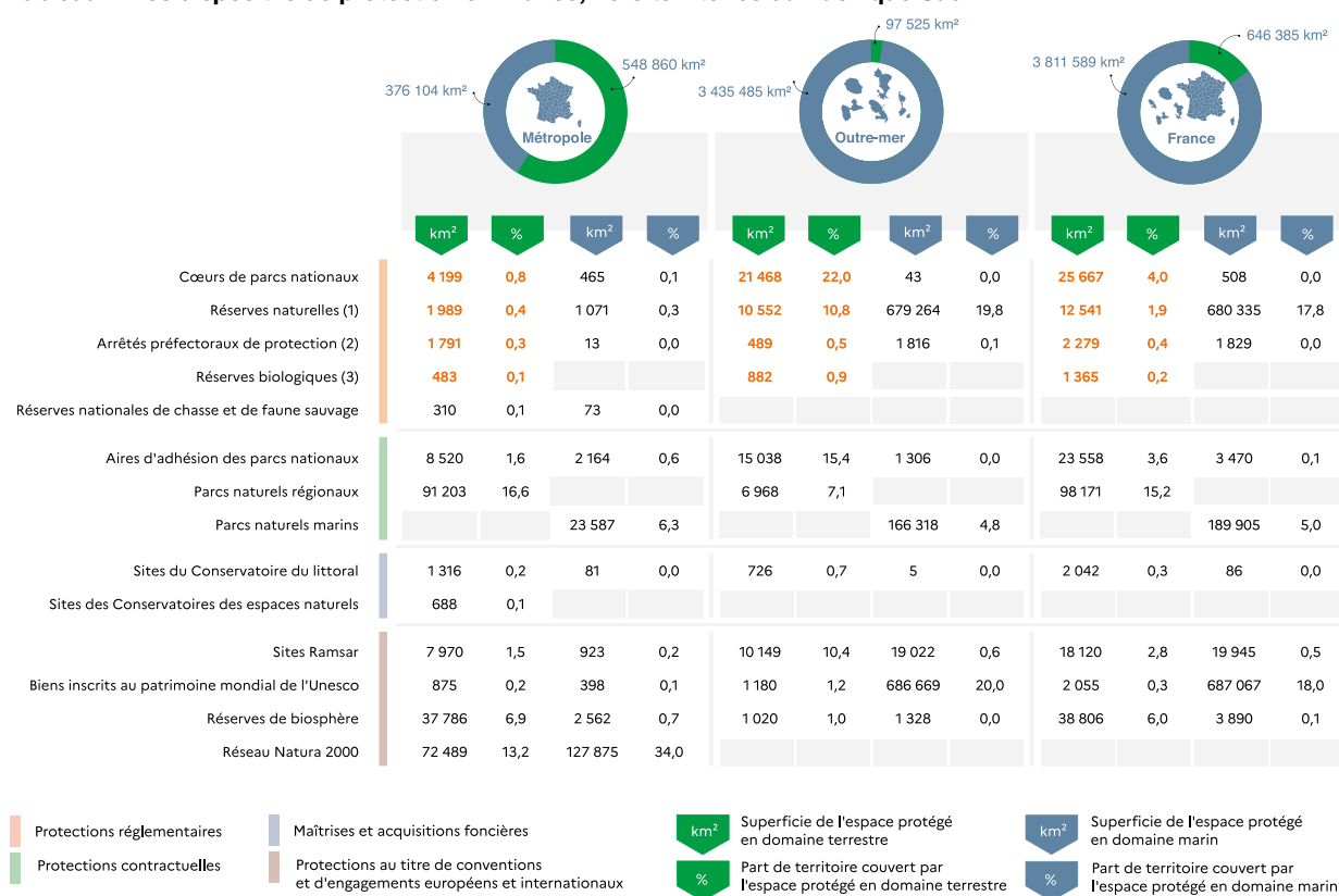
Tableau 1 : les dispositifs de protection en France, hors territoires du Pacifique Sud

(1) nationales, régionales, de Corse ; (2) de biotope, de géotope, d'habitats naturels ; (3) intégrales et dirigées. Notes : en haut de l'infographie, les pictos représentent les superficies de référence pour chaque territoire. Les territoires d'outre-mer pris en compte sont les 5 DROM (Martinique, Guadeloupe, Guyane, La Réunion et Mayotte) ainsi que les collectivités de Saint-Pierre-et-Miquelon, Saint-Martin, Saint-Barthélemy et les Terres australes et antarctiques françaises. Ce tableau comptabilise les surfaces concernées par chaque dispositif de protection. La somme des différentes surfaces ne permet pas de définir la couverture globale des espaces protégés en France car certaines surfaces sont couvertes par plusieurs dispositifs (doubles comptes). Les chiffres indiqués en orange sont ceux qui sont reconnus comme protections fortes terrestres au moment de l'adoption de la SNAP (de nouvelles catégories seront prises en compte en fonction de critères définis lors du premier plan d'action). Source : UMS Patrinat et OFB, base Espaces protégés de mars 2021, base Natura 2000 de décembre 2020